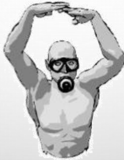
OK (de loin)