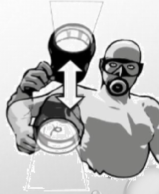
Signe ALERTE (problème)