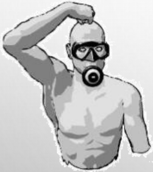
OK (de près)